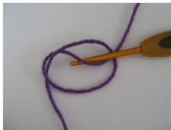
MR Magisk ring (2)