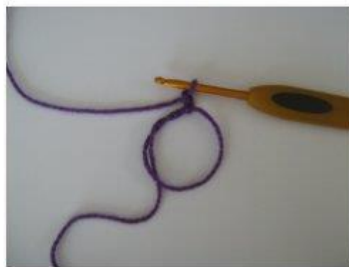
MR Magisk ring (5)