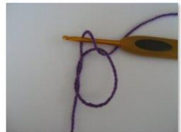
MR Magisk ring (3)