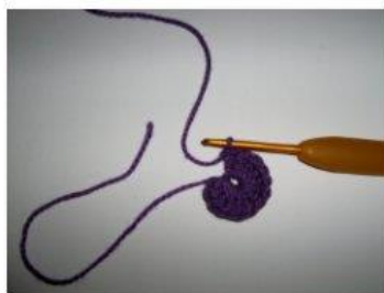
MR Magisk ring (8)