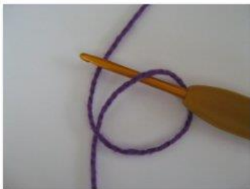
MR Magisk ring (1)

Fortsæt til du har det antal masker du skal have. Træk arbejdet sammen ved at trække i den korte ende.