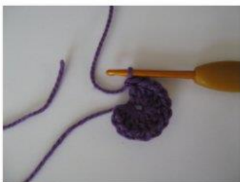
MR Magisk ring (7)