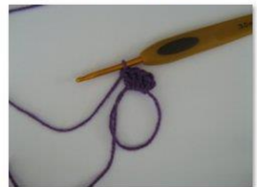
MR Magisk ring (6)