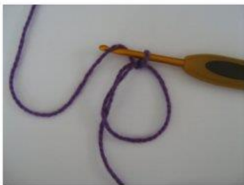
MR Magisk ring (4)