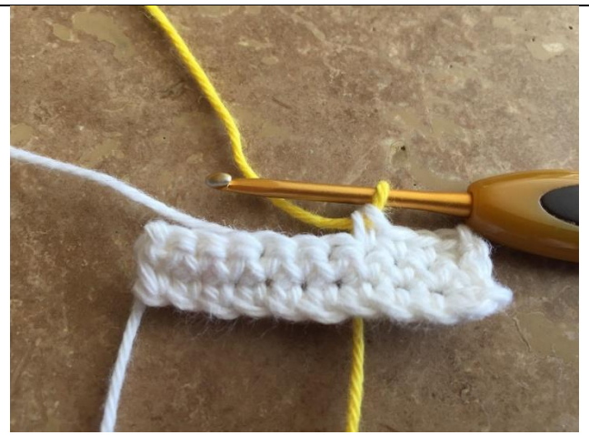
Træk igennem sidste gang med ny farve