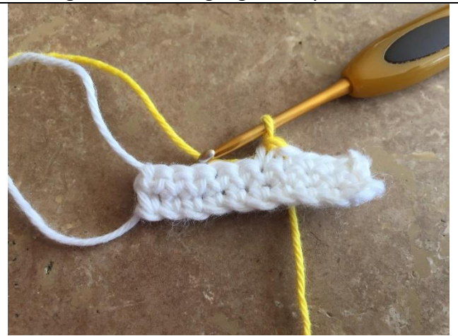
Træk igennem sidste gang med ny farve