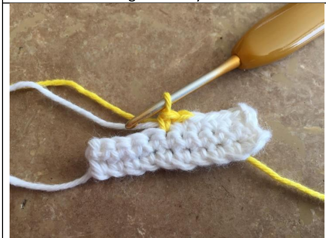
Hækl m med ny farve