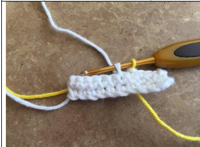
Næste m sluttes også med ny farve