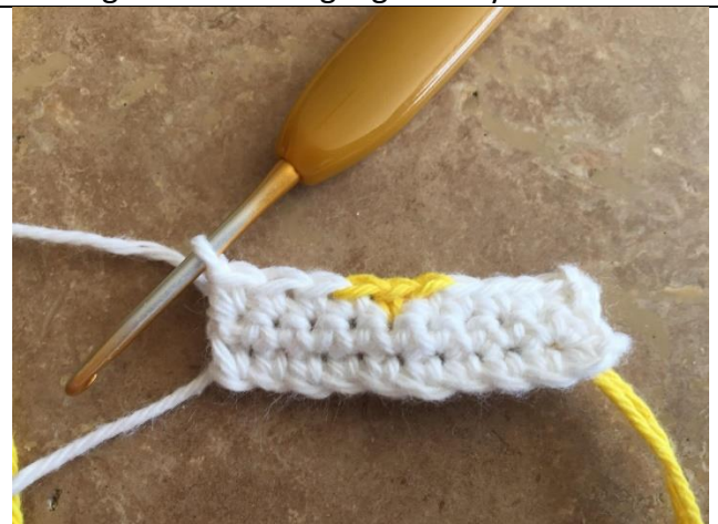
Som det ses, er der hæklet således at der på næste omg. skal hækles 3 m med ny farve uden at farveskiftet ses i bunden.