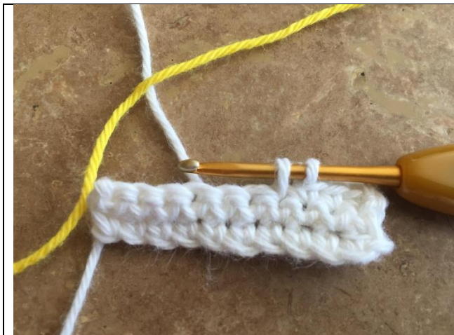
2 m før ny farve m, sluttes m med ny farve

Farveskift når der hækles rundt. Denne metode kan bruges når der hækles rundt, således at farveskiftet ikke ses så tydeligt. Dette gentages på hver omg. når der øges med 1 m i farveskift til hver side. Hvis det skal gå lige op, bruges en anden metode.